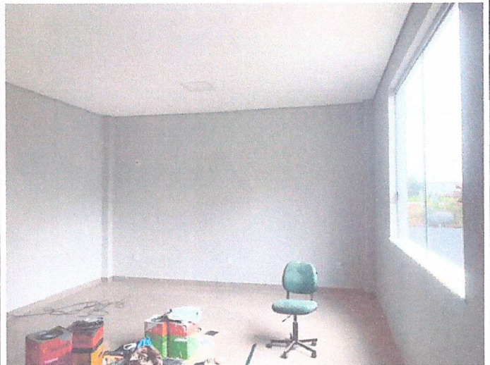
Descrição: EXECUÇÃO DE PINTURA E EMASSAMENTO DO FORRO