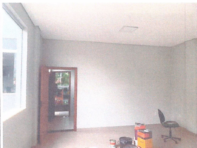
Descrição: EXECUÇÃO DE PINTURA SALA DO 2º PAVIMENTO