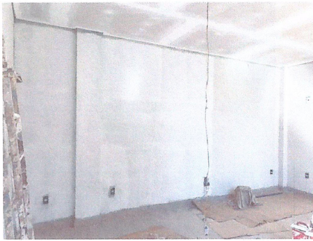
Descrição: EXECUÇÃO DE PINTURA SALA DO 2º PAVIMENTO